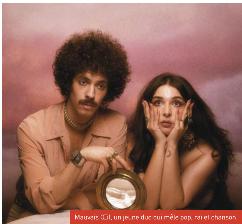
Mauvais Œil, un jeune duo qui mêle pop, rai et chanson.