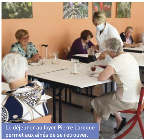
Le déjeuner au foyer Pierre Laroque permet aux aînés de se retrouver.