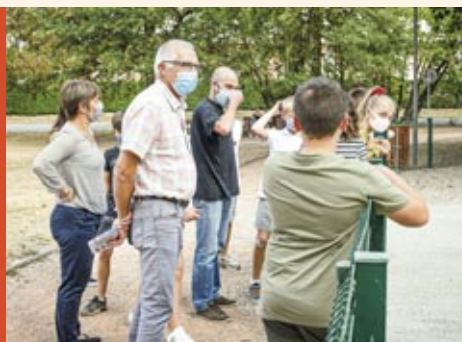
Le 16 septembre, présentation d'un projet du conseil municipal enfants : celui d'un jeu adapté à tous les enfants.