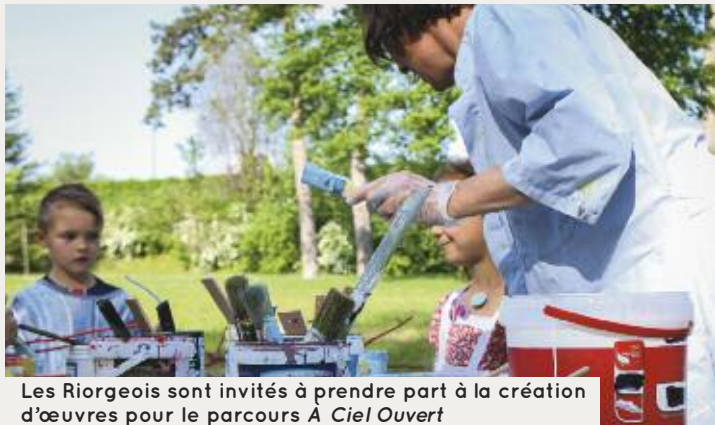
Les Riorgéois sont invités à prendre part à la création d'œuvres pour le parcours A Ciel Ouvert