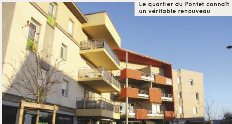
Le quartier du Pontet connaît un véritable renouveau