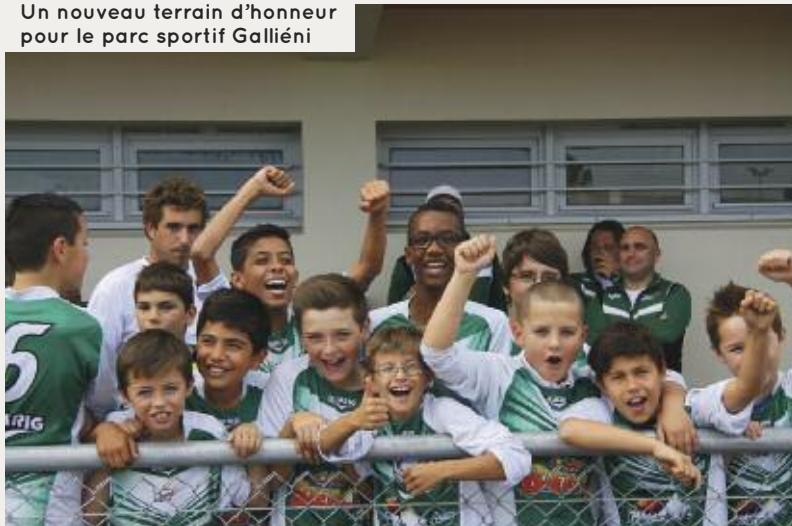
Un nouveau terrain d'honneur pour le parc sportif Galliéni