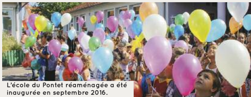
L'école du Pontet réaménagée a été inaugurée en septembre 2016.

Ma fille a participé cette année à plusieurs activités Tempo : tir à l'arc, arts plastiques, paperkraft ou encore zumba. Dès que le programme arrive à la maison, elle fait ses choix ! Elle apprend plein de choses, fait des activités manuelles et sportives. Par ailleurs, elle a vivement souhaité s'investir dans le conseil municipal enfants. Elle aimait l'idée de prendre part à des projets de la ville. Je trouve qu'il est vraiment positif de permettre aux enfants de s'impliquer dans la vie riorgeoise.