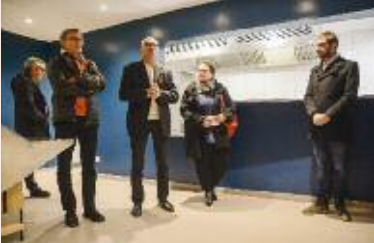
Inauguration des nouveaux espaces de la salle du Grand Marais le 17 janvier.