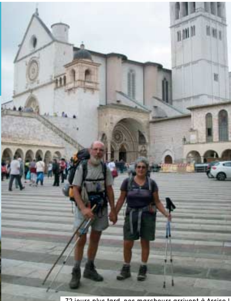
72 jours plus tard, nos marcheurs arrivent à Assise !