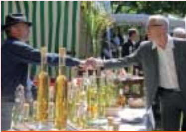
L'édition 2014 de la fête des Fleurs.