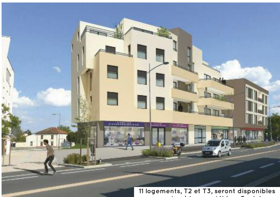
11 logements, T2 et T3, seront disponibles en accession à la propriété au Pontet.