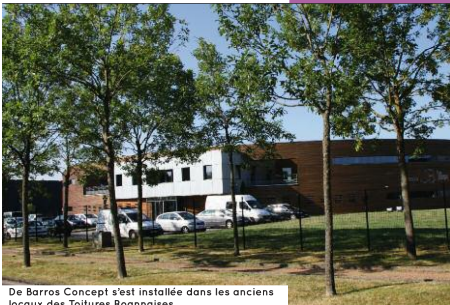
De Barros Concept s'est installée dans les anciens locaux des Toitures Roannaises.