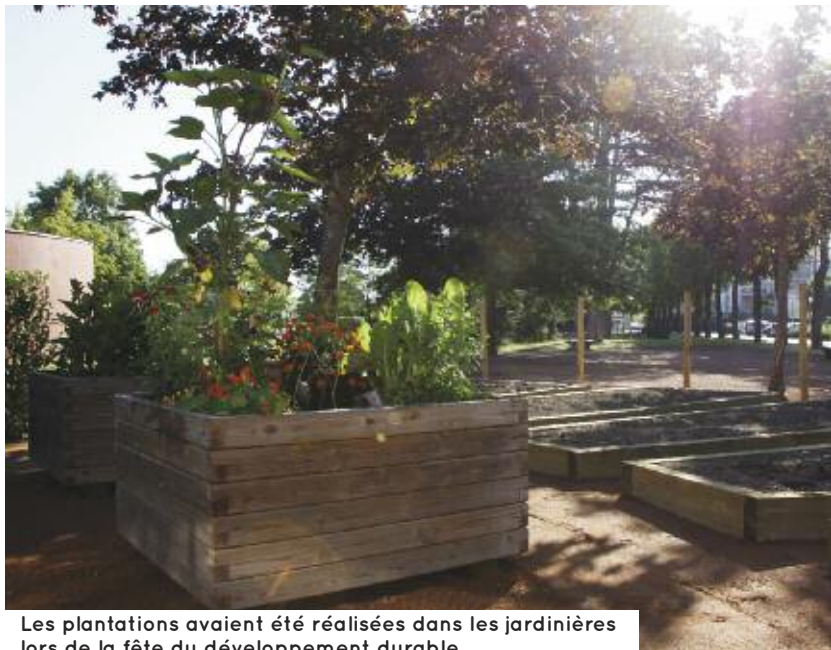
Les plantations avaient été réalisées dans les jardinières lors de la fête du développement durable.

Situé aux abords du centre social, le jardin pédagogique va pouvoir être partagé entre les enfants du centre de loisirs et de Loisiriorges, les familles fréquentant le centre social mais aussi par les tout-petits de la crèche Pom'Vanille. Entièrement clos, il dispose de 45 m 2 de pleine terre cultivable et de bacs hors-sol. Les jardinières avaient d'ailleurs reçu de premières plantations lors de la fête du développement durable