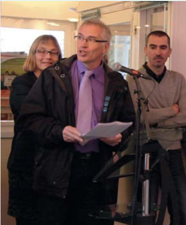
Fête de Noël à Quiétude, le 17 décembre 2014