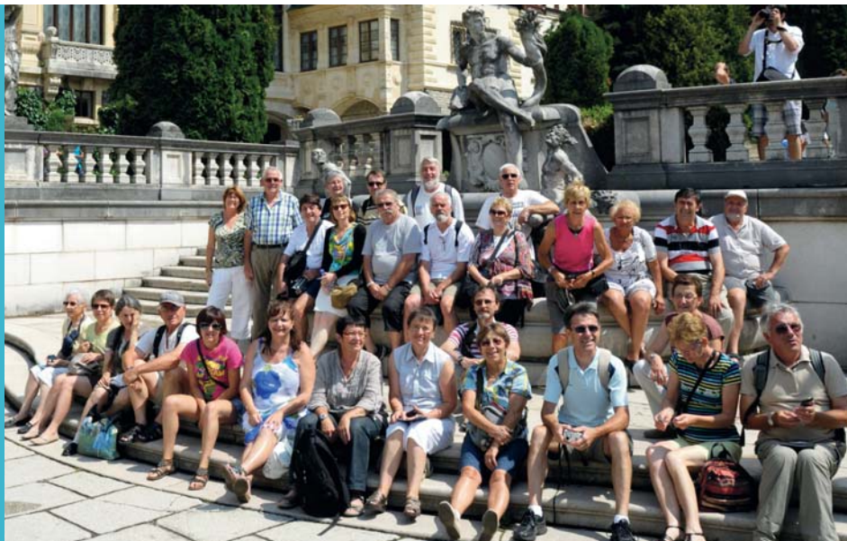
Les membres du Roannais Piatra Neamt se rendent régulièrement en Roumanie.

LA VILLE DE RIORGES, AUX CÔTÉS DES VILLES DE ROANNE, MABLY ET VILLEREST, S'IMPLIQUE DANS LE JUMELAGE AVEC LA VILLE ROUMAINE DE PIATRA NEAMT.